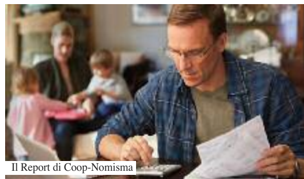
Il Report di Coop-Nomisma

Gli italiani si affacciano al 2026 con più preoccupazione che speranza. In un contesto segnato da conflitti bellici, diseguaglianze sociali e cambiamento climatico, la parola più utilizzata per descrivere l'anno che verrà è "preoccupazione" (37%), seguita da "insicurezza" (23%). Non manca però una quota di resilienza: il 25% continua ad affidarsi all'ottimismo e il 24% richiama curiosità e fiducia. Lo rivelano le due survey dell'Ufficio studi Coop condotte a dicembre 2025 (la prima su un campione rappre-