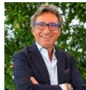
Di Pisa: "Ripensare il futuro dei mercati all'ingrosso"

tratto. Il contratto - alla fine - è un traguardo complessivo che va oltre al semplice "lavorare". Perché al contratto sono collegate antiche e nuove tutele, dal welfare alla formazione, che ci permettono di affrontare meglio e con più qualità le sfide della modernità di cui parliamo prima. Il contratto è al cuore del nostro essere e fare sindacato, della nostra credibilità e autorevolezza come corpo intermedio. Un contratto come il nostro è equilibrato e strategico, non a caso adottato da oltre il 90% delle imprese italiane del terziario, e mette sempre al centro le persone che fanno e si sentono comunità. Come nelle nostre Associazioni, fare comunità, fare squadra è l'unico modo che ci permette di far fronte alle grandi sfide del presente e del futuro. Davanti alla complessità del mondo contemporaneo (vale in politica, in associazione o dentro le imprese) nessuno si salva da solo. Nessuno si salva da solo. Perché nessuno dispone di tutta la conoscenza necessaria per gestire tutta l'innovazione, per orientarsi in tutta la complessità del presente.