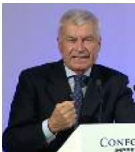
Sangalli: “Categoria importante con un legame solido con tutta la filiera”

"I grossisti sono una categoria tradizionale del nostro sistema di approvvigionamento alimentare, ma sono, comunque, una categoria giovane. Un quarto dei vostri associati ha meno di 40 anni, la metà ne ha meno di 50 e il ricambio nelle imprese familiari resta la sfida cruciale. Per questa ragione e per l'integrazione con il resto della filiera la vostra categoria sta rispondendo in modo reattivo al cambiamento. Certo restano le criticità storiche, dagli investimenti alla burocrazia. Ma oltre alle antiche criticità, ci sono poi le sfide dei nostri giorni, come quella della sostenibilità ambientale e quella della transizione digitale. Ed entrambe riguardano tutti, cittadini ed imprese, compreso il vostro mondo. Richiamando ancora i vostri dati, mi pare che uno delle vo-