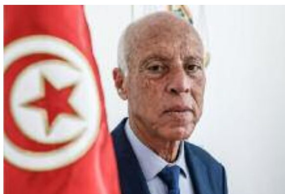
Nella foto il presidente tunisino Kaïs Saïed

I sostenitori di Saïed hanno definito i dieci anni post rivoluzione 2011 il "decennio oscuro", ma le tenebre sulla società tunisina sono piombate dopo il 2021, quando il regime ha licenziato oltre cinquanta giudici, permettendo il controllo governativo sul sistema giudiziario; quando ha imposto una sorveglianza ossessiva sulla stampa e sui media, limitando drasticamente la libertà di espressione. Questa modalità di controllo mediatico si è suggellata con l'entrata in vigore del decreto legge numero 54, promulgato nel settembre 2022. Tale provvedimento è finalizzato a combattere le fake news definite tali da una commissione totalmente non arbitra e indirizzata a dichiarare false notizie tutte quelle informazioni antigovernative alle quali si attribuisce il bollo di "minaccia per la sicurezza dello Stato". L'incarcerazione, nel 2023, di Rached Ghannouchi, capo del partito islamista Ennahda e di molti suoi dirigenti, oltre la repressione anche carceraria di oppositori di altri partiti, è stata configurata come una azione contro complottisti antigovernativi, che cospiravano insieme a potenze e intelligence straniere. Processi sistematici e in-