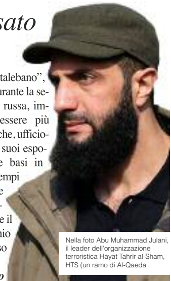
Nella foto Abu Muhammad Julani, il leader dell'organizzazione terroristica Hayat Tahrir al-Sham, HTS (un ramo di Al-Qaeda)