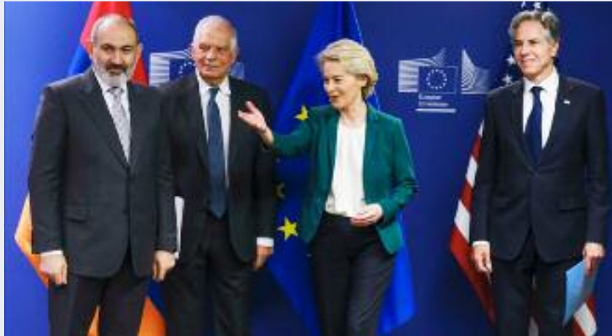
Nella foto sopra, da sinistra: il primo ministro dell'Armenia, Nikol Pashinyan, l'alto rappresentante Ue per gli Affari esteri e la politica di sicurezza, Josep Borrell, la presidente della Commissione Europea, Ursula von der Leyen, e il segretario di Stato statunitense, Antony Blinken durante un incontro nell'aprile 2024

Pashinyan si è limitato a dire che l'Armenia è pronta ad "avvicinarsi all'UE nella misura in cui quest'ultima lo ritenga possibile", consapevole del fatto che Bruxelles non dà priorità all'adesione nel prossimo futuro. Ha anche affermato che qualsiasi referendum potrebbe avvenire solo dopo i colloqui con l'UE. Sebbene l'Armenia accusi la Russia per la sconfitta nel Nagorno Karabakh, sta tentando di emanciparsi da Mosca come unico referente per la sicurezza, ma fare altrettanto nelle sfere economica ed energetica sarà molto difficile. Secondo i media, l'anno scorso il 42% del commercio estero è avvenuto con la Russia, solo il 7,3% con l'UE. L'Armenia dipende inoltre esclusivamente dalla Russia per il gas e combustibile nucleare. Senza sbocco sul mare e bloccata dall'Azerbaijan e dalla Turchia, Yerevan non ha rotte sufficienti per beneficiare del mercato UE e dipende da Georgia e Iran. La Russia da parte sua ha chiarito che l'adesione all'UE significherebbe l'esclusione dall'Unione economica eurasiatica (EEAU). Alcuni