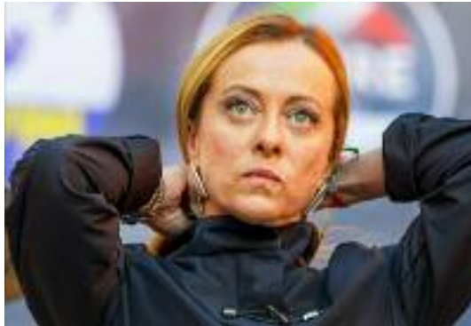
Landini: “La Manovra porta il Paese a sbattere”

“La sinistra non riesce a gioire per la tregua” in Palestina “perché ora non sa cosa fare col business della guerra, non ci facciamo fare la morale da una sinistra sempre più radicalizzata. Ma quale campo largo, è un Leoncavallo largo, un enorme centro sociale. Noi siamo fieri di non essere come loro”. “La nostra storia dimostra che siamo nati per stravolgere i pronostici. Possiamo vincere, proprio come dicevano che non potevamo arrivare al governo della nazione”, conclude.